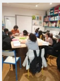
Echange préalable avec l'équipe du théâtre pour préparer la sortie