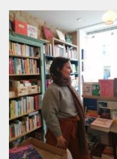
Le métier de journaliste, de boulanger et de libraire